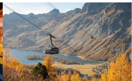
Furtschellas in autunno.