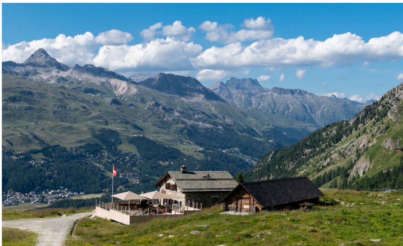
Gustosi pranzi e merende: l'Alpetta è aperta anche in estate.

Il Corvatsch ospita la distilleria di whisky più in quota del mondo! In cooperazione con la Corvatsch AG, la manifattura di whisky svizzera ORMA (anima in romancio) offre un'esperienza unica a 3303 metri sopra il livello del mare. Le visite guidate e le degustazioni avvicinano i visitatori all'oro liquido. Prima o dopo la degustazione, i visitatori possono gustare un menu ORMA servito al Ristorante 3303, l'esercizio gastronomico più in quota dei Grigioni. Le visite guidate hanno luogo mercoledì, venerdì e sabato e sono prenotabili online sul sito web alla rubrica «Shop». Per informazioni dettagliate: www.ormawhisky.ch