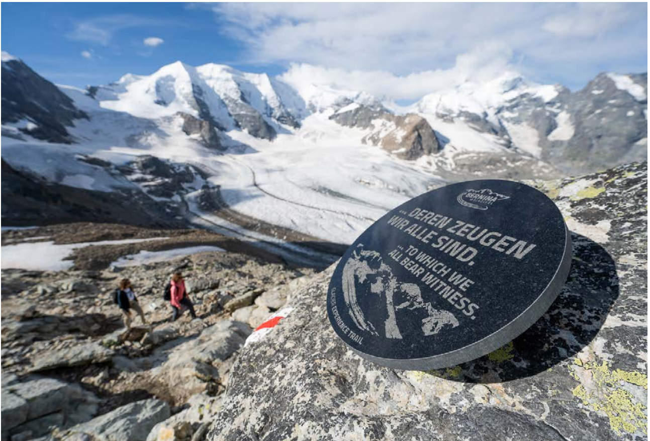
Glacier Experience Trail: l'esperienza sui ghiacciai per gli escursionisti.