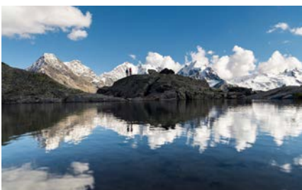
Corvatsch – Fuorcla Surlej.