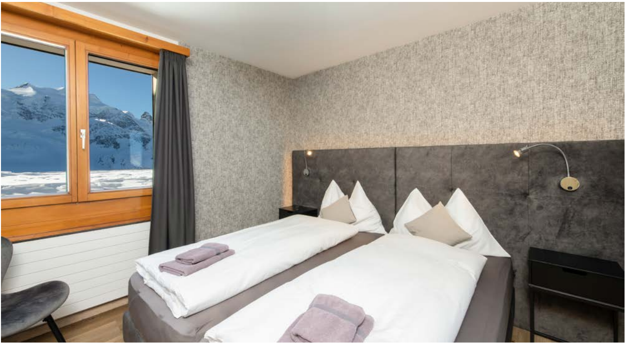
Una camera doppia del rifugio Berghaus Diavolezza.

Un pranzo gustoso e un sonno ristoratore al rifugio Berghaus . La struttura offre dormitori per gruppi, semplici camere da sei, da quattro o da due posti ma anche confortevoli camere doppie con bagno privato. Dopo la gustosa cena di quattro portate si possono ammirare la vista indisturbata sulle vette illuminate dalla luce notturna e il cielo stellato. O ancora con una nota più romantica: osservare le stelle e distendersi a quasi 3000 metri di quota nella vasca jacuzzi esterna.